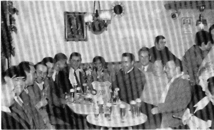
Alte Herren des SSV Liesen nach dem 1. Meisterschaftsspiel in Elleringhausen im Jahre 1970 in gemütlicher Runde bei: